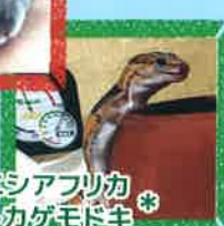
*ニシアフリカ トカゲモドキ* (名前は無いです)

生き物と音楽が大好きです! 家ではハムスターや 爬虫類に囲まれており、 いつも癒しと元気をもらって います。 90年代のロックバンドが 大好きで、よく当時のCDや DVDなどを集めて 聴いています!