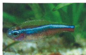
グリーンネオンテトラ 体長：約3 cm ネオンテトラよりも 赤い部分が大きいのが 特徴です。