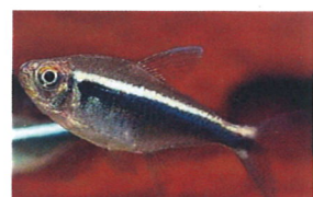
ブラックネオンテトラ 体長：約3 cm エサをよく食べます。 水草水槽によく映えます。