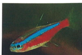
カージナルテトラ 体長：約4 cm ネオンテトラよりも 赤い部分が大きいのが 特徴です。