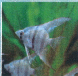
エンゼルフイッシュ 体長：約7cm

丈夫で相性の悪い魚もないため、水槽の環境を選ばずに飼育できる。大型水槽で群れ作って泳ぐ姿は、水草水槽によく映え美しい。