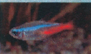
ネオンテトラ 体長：約2cm

丈夫で相性の悪い魚もないため、水槽の環境を選ばずに飼育できる。大型水槽で群れ作って泳ぐ姿は、水草水槽によく映え美しい。