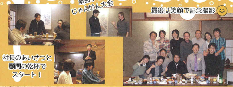
社長のあいさつと顧問の乾杯でスタート！