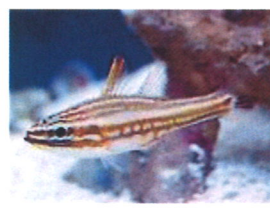
マルガリータカージナルフィッシュ 体長：約5 cm 非常に大人しい魚です。飼いこむと体のラインに赤みがかかり、より綺麗になります。