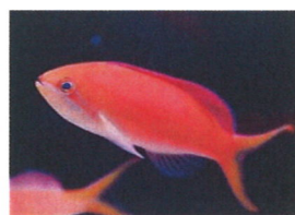
アカネハナゴイ 体長：約8 cm 群れを作ると落ち着くので、複数匹の飼育が向いています。