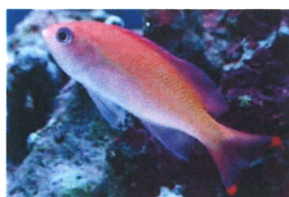
ケラマハナダイ 体長：約10 cm 群れになる習性があり、温和で人によく馴れます。