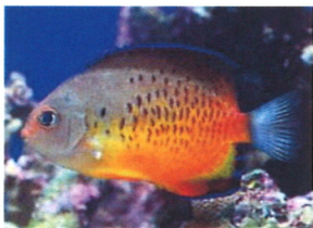
アカハラヤッコ 体長：約10 cm 飼いこむとヒレの青い部分により深みを増してきます。