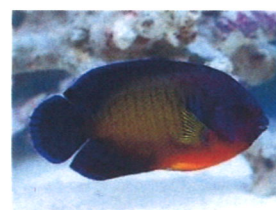
ルリヤッコ 体長：約10 cm 深い青色が特徴的で、サンゴ砂によく映えます。