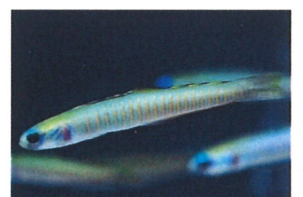
ゼブラハゼ 体長：約10 cm 臆病な性格で、水槽に入れたばかりの頃は、隠れてしまうことがあります。