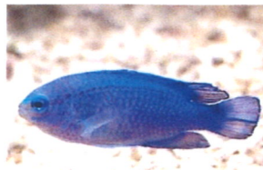
ルリスズメダイ 体長：約6 cm 成長すると縄張り争いをするようになります。