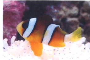
クマノミ 体長：約8 cm 丈夫で飼いやすいですが、縄張り意識が強いです。