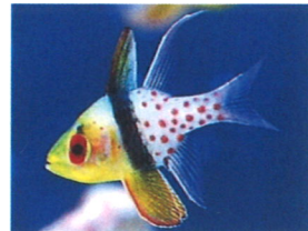
マンジュウイシモチ 体長：約5 cm 非常に大人しい魚です。水槽内を漂うように泳ぎます。