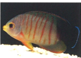
エイブルズエンゼルフィッシュ 体長：約10 cm オレンジの縞模様は、成長するにつれて、次第に濃く、鮮やかになっていきます。