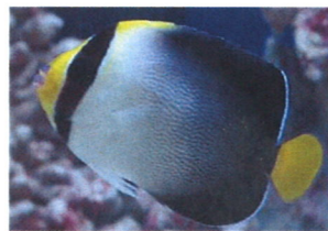
チリメンヤッコ 体長：約12 cm 模様が織物のちりめんのように見えるのが、名前の由来です。