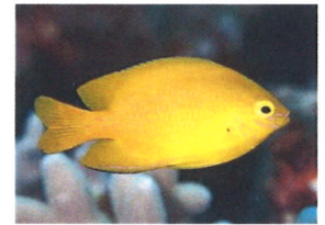
ネットアイスズメダイ 体長：約8 cm 鮮やかな色彩が人気です。縄張り意識が強いです。