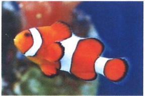
カクレクマノミ 体長：約7 cm イソギンチャクと共生している姿を見る事ができます。