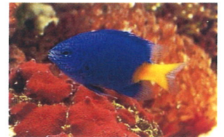
シリキルリスズメダイ 体長：約6 cm 縄張り争いをするので、体の小さい種類との混泳は難しいです。