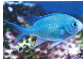
デバスズメダイ 体長：約6 cm 大人しい性格で、10匹単位だと群れを作って泳ぎます。