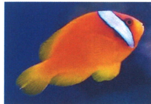
ハマクマノミ 体長：約8 cm 丈夫で飼いやすいですが、成長すると気が強くなります。