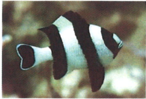
ヨスジリュウキュウスズメダイ 体長：約5 cm 気が強いので、体の小さい種類とは混泳出来ません。