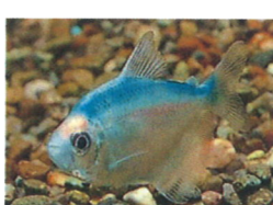
カラーブラックテトラ 体長：約5 cm 人工的に色素を入れています。 他にも様々な色があります。