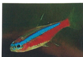
カージナルテトラ 体長：約4 cm ネオンテトラよりも 赤い部分が大きいのが 特徴です。