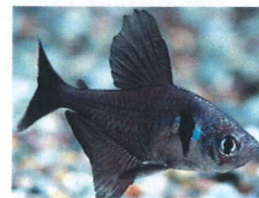
ブラックファントムテトラ 体長：約4 cm 独特な色合いが水草と 良く合います。