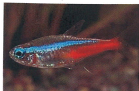
ネオンテトラ 体長：約4 cm 丈夫でキレイです。 群れて泳ぎます。