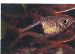
ラスボラ・ヘテロモルファ 体長：約4 cm ピンク色に発色します。 水草水槽によく映えます。