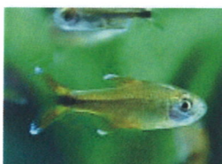
ハセマニア 体長：約4 cm ヒレの先が白いことから、 シルバーチップテトラ とも呼ばれています。