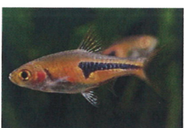
ラスボラ・エスベイ 体長：約4 cm オレンジ色に発色します。 群れて泳ぎます。