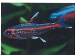
グローライトテトラ 体長：約3 cm 丈夫で大人しいです。 飼育しやすい種類です。