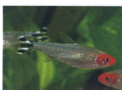
ラミーノーズテトラ 体長：約5 cm 頭が赤く発色します。 キレイに群泳します。