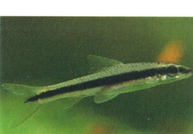
フライングフォックス 体長：約6 cm ヒゲ状のコケをよく食べます。 大きくなります。