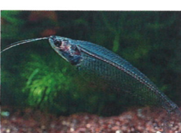
トランスルーセント・ グラスキャット 体長：約5 cm 丈夫で水槽内を元気よく 泳ぎ回ります。