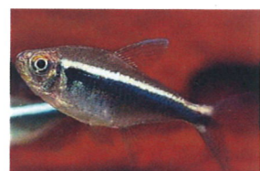
ブラックネオンテトラ 体長：約3 cm エサをよく食べます。 水草水槽によく映えます。