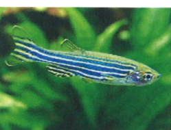
ゼブラダニオ 体長：約4 cm 丈夫で水槽内を元気よく 泳ぎ回ります。