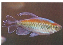
コンゴテトラ 体長：約10 cm ヒレが長く優雅です。 やや大きくなります。