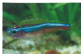
グリーンネオンテトラ 体長：約3 cm ネオンテトラよりも 赤い部分が大きいのが 特徴です。