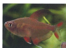
ロージーテトラ 体長：約5 cm 桃赤色の体色をしています。 体高があるお魚です。