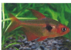
レッドファントムテトラ 体長：約4 cm 飼いこむと赤がより 濃くなります。