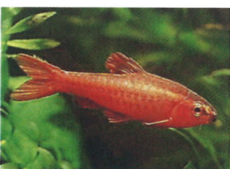
チェリーバルブ 体長：約4 cm 発情期のオスは体色が 鮮紅色に染まります。