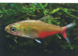
グリーンファイヤーテトラ 体長：約4 cm 温和な性格です。 群れて泳ぎます。